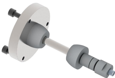
KCM100 Montage Vorrichtung für Motorrad Felgen