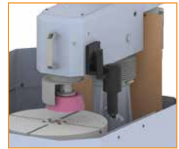
PV0909 Dispositivo tornitura bordo volani incassati Corner cutting tool for recessed flywheels Dispositif tournage épaule volant Dispositivo para tornejar volantes embudidos