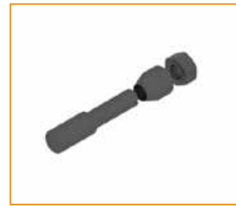
RTV591 Adattatore M12/M16 per volani piccoli Small hole flywheel adapter M12/M16 Adaptateur pour petites volantes Adaptador para volantes pequeños